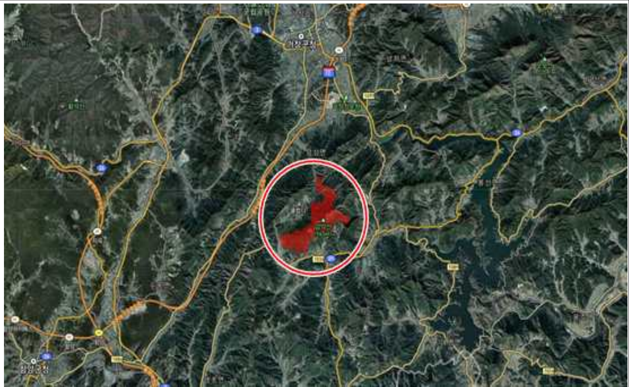
위치 : 신원면 덕산리 산13-1 등 13필지