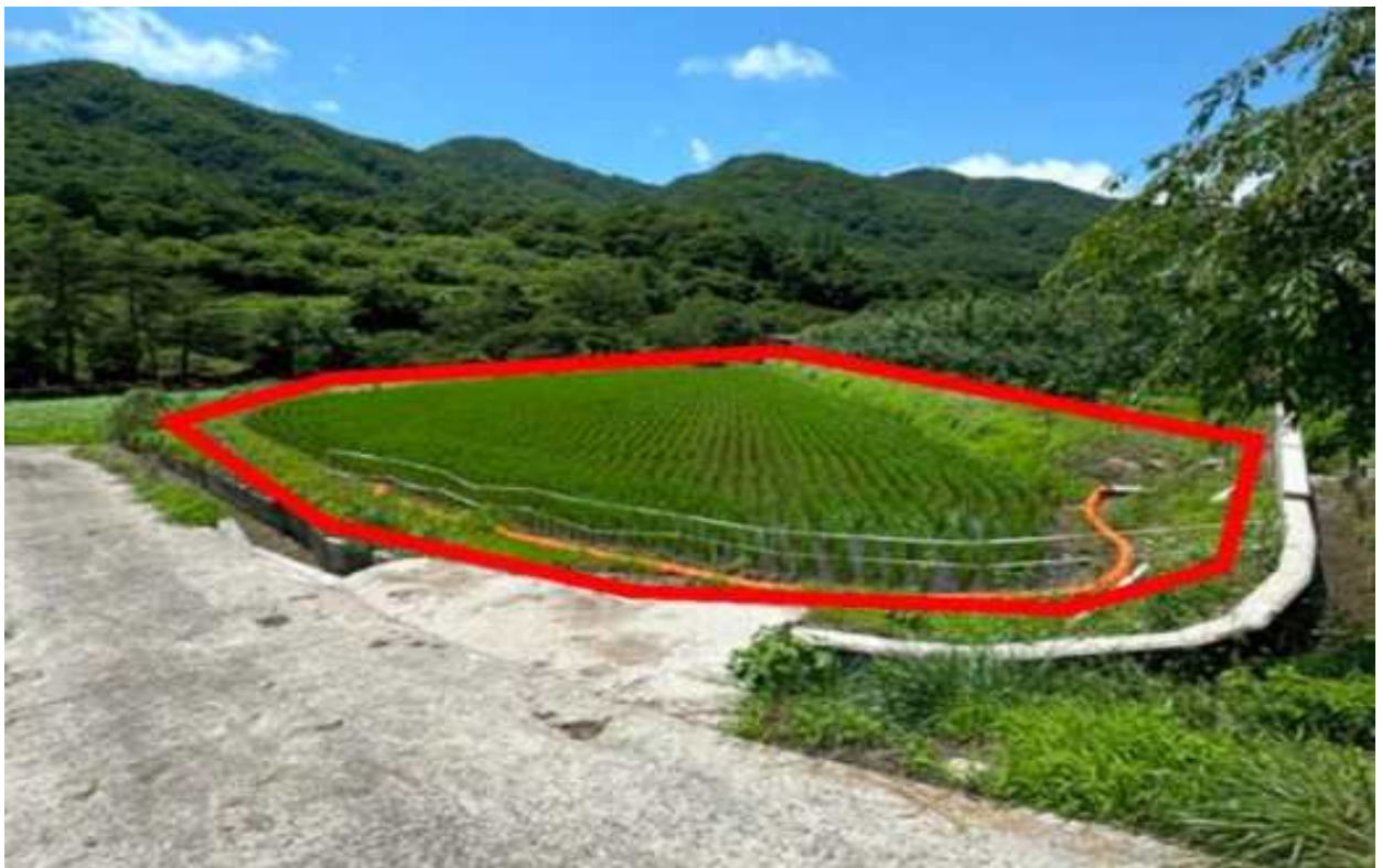
현 장 사 진