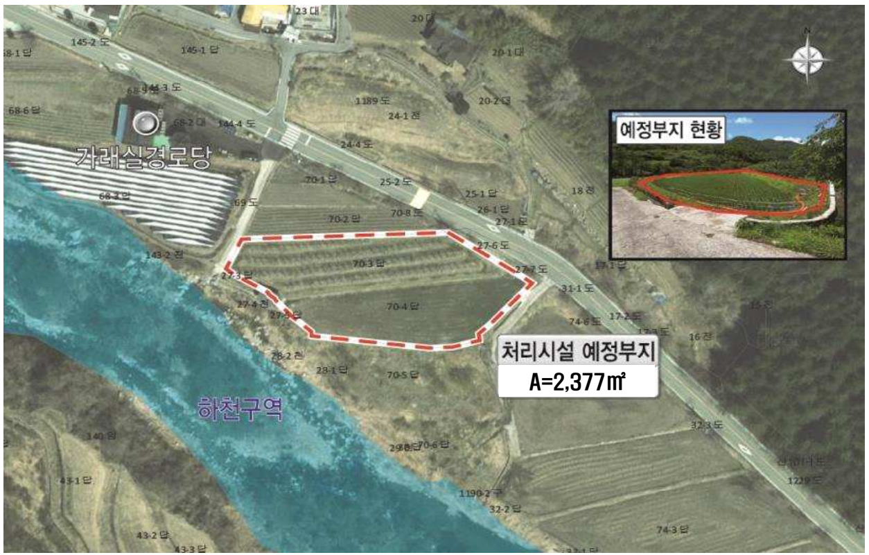
위 치 도