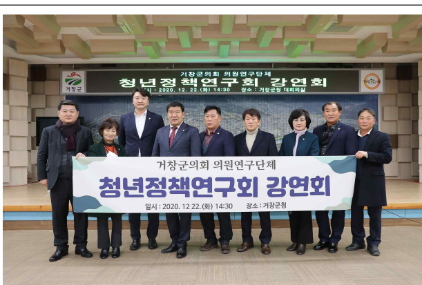
1차 전문가 강연