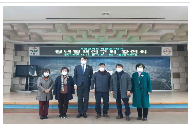
2차 전문가 강연