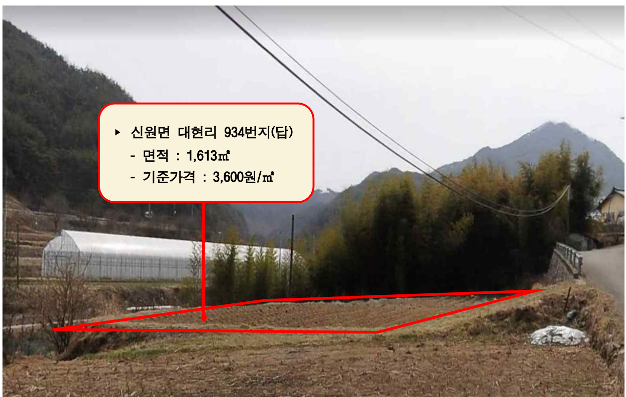
현 장 사 진