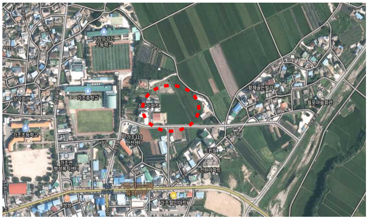
사진설명 : 수월공원 위치도