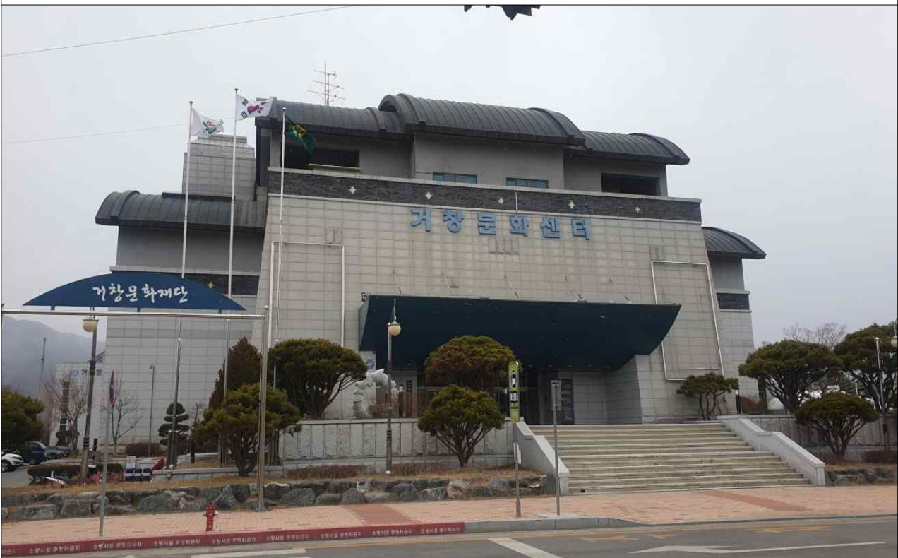
사진설명 : 거창읍 수남로 2181 현장사진