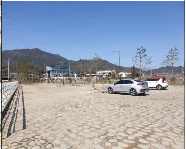
마리면 : 마리면 말흘리 217-2, 말흘리 217-4/주차장(토지)