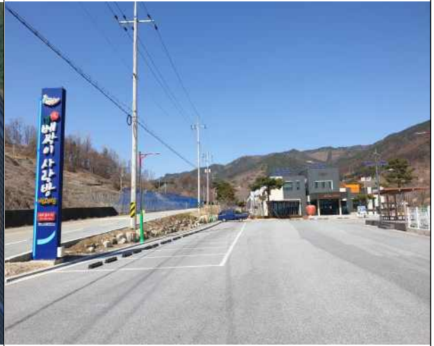
고제면 : 고제면 봉계리 85-1/ 주차장(토지)