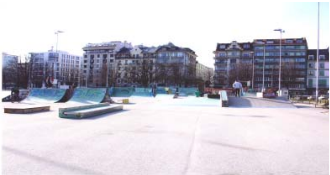
【 스위스 스테이크 파크 】