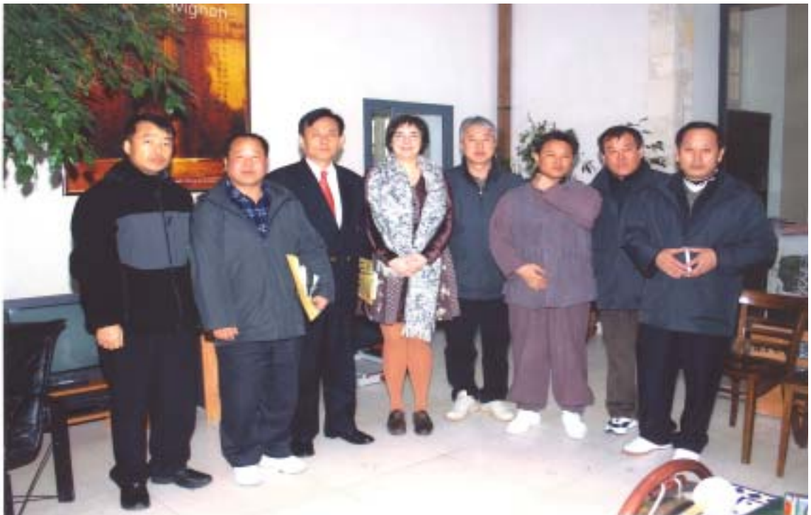
【 아비농 페스티벌 조직위원회 방문기념 촬영장면 】