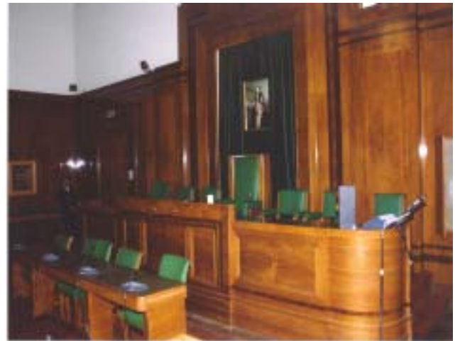
【 왼쪽: HECKNEY시 의회 기념촬영, 오른쪽 : 본회의장 】