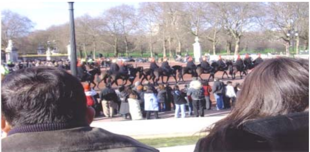
【 버킹검 궁전 앞에서 본 하이드 파크 】