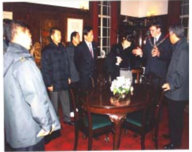
【 HECKNEY시 의장이 시의회의 운영을 설명하고 있는 장면】