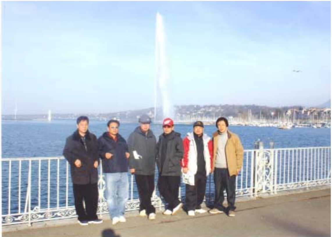
【 스위스 제네바 제또 분수 】