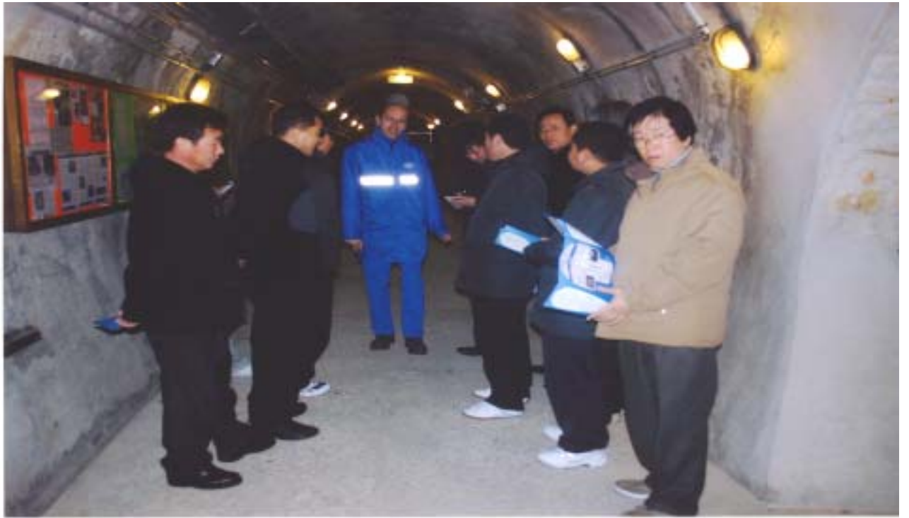
【 시설관계자로부터 설명을 듣고 있는 장면 】