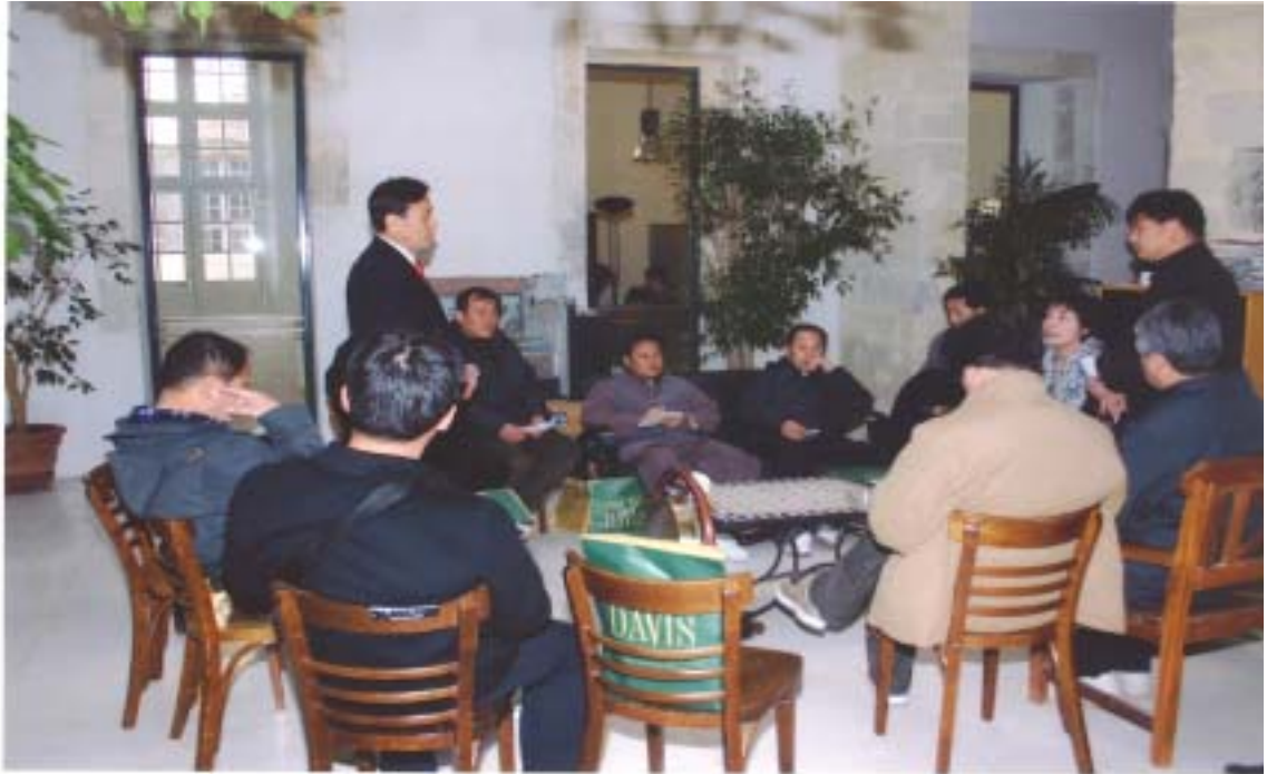
【 아비농 페스티벌 조직위원회 방문 】