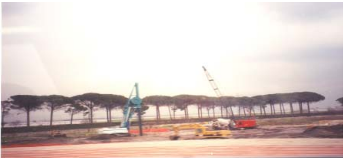
【이탈리아 로마 진입로 소나무 가로수】