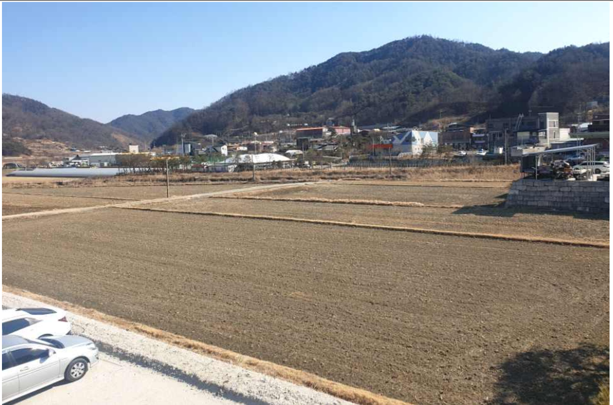
사진설명 : 마리면 말흘리 220-1번지