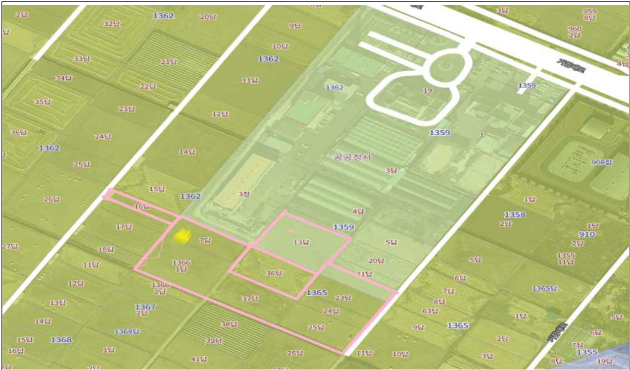
사진설명 : 거창읍 대평리 농업기술센터 뒤편 부지 (36답 제외)