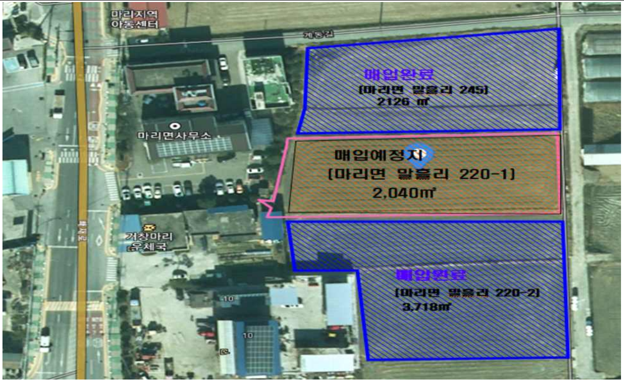
사진설명 : 마리면 말흘리 220-1번지