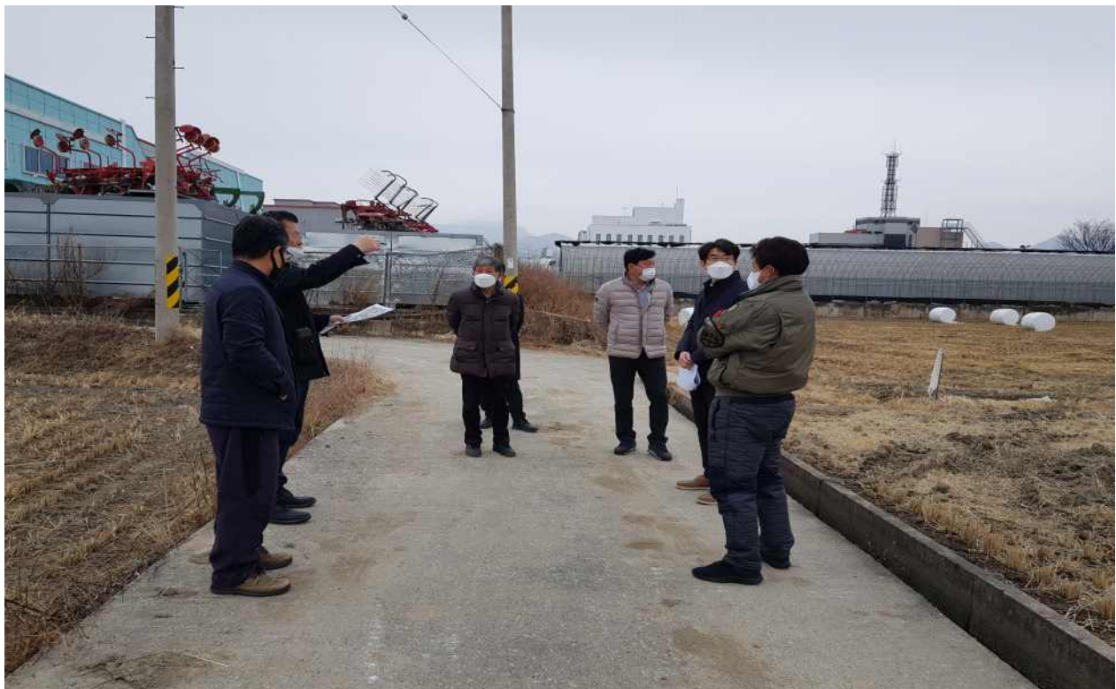
사진설명 : 현장 전경