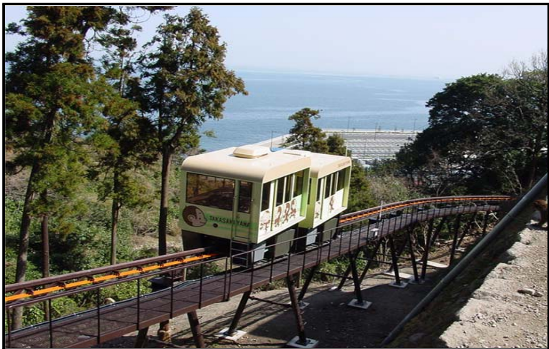
【 케도차 전경 】